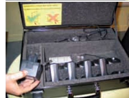
Le guide-conférencier porte un micro avec un amplificateur et les visiteurs, équipés de récepteur reçoivent un son amplifié, sans bruits parasites extérieurs.