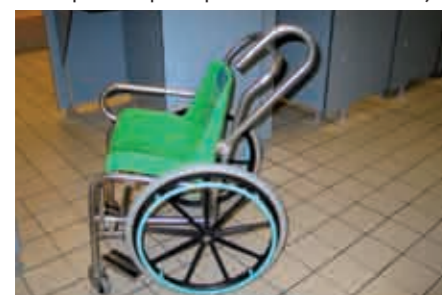
Fauteuil adapté aux piscines - St Valery en Caux