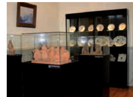
Musée Municipal des Ivoires d'Yvetot : passage entre le mobilier contrasté, approche des œuvres.