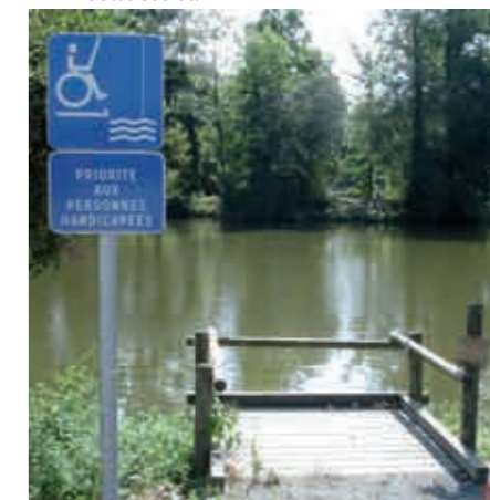
Ponton pêche adapté