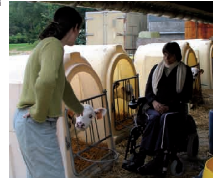
Visite commentée à St Vaast Dieppedalle de la ferme «les près d'Artemare» : présentation de l'élevage, transformation du lait en beurre, fromage, ...

Il faut alors penser à toutes les solutions techniques qui facilitent la vie des accompagnants (palier de repos, bancs, tapis ou caillebotis sur les galets, ...).