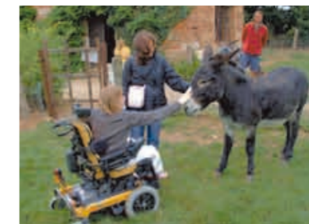
Parcours découverte de l'exploitation, écomusée sur le lin et boutique à la Ferme au Fil des Saisons à Amfreville les Champs