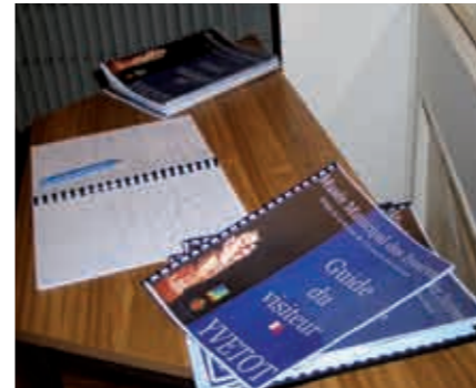
Guide de visite en caractères agrandis et traduit du Musée Municipal des Ivoires d'Yvetot qui propose également des audio-guides