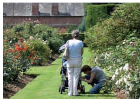
La roseraie et le parc du château du Mesnil Geoffroy à Ermenouville ne sont pas labélisés «Tourisme et handicap» en raison de petits ressauts liés aux bordures de grès du XVIème siècle et de l'absence de sanitaires. Néanmoins, le public s'est «passé le mot» pour venir découvrir ce site remarquable avec le «coup de main» de l'accompagnant. C'est aussi un endroit très fréquenté par les familles avec poussette.