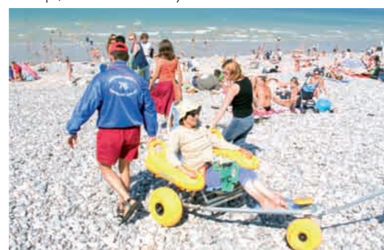
Tiralo® sur la plage de Saint Valery en Caux. Un stationnement à proximité et un cheminement adapté pour rejoindre le front de mer permet à l'utilisateur d'utiliser une cabine de déshabillage accessible ainsi que des sanitaires et une douche. Mis à disposition gratuitement au poste des surveillants de baignade, il nécessite l'aide d'un accompagnant pour rejoindre la zone de baignade ou le sable