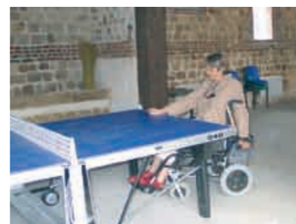
Salle d'activités couverte avec table de ping-pong accessible au Village de Vacances le Pré Marin à Sotteville sur Mer