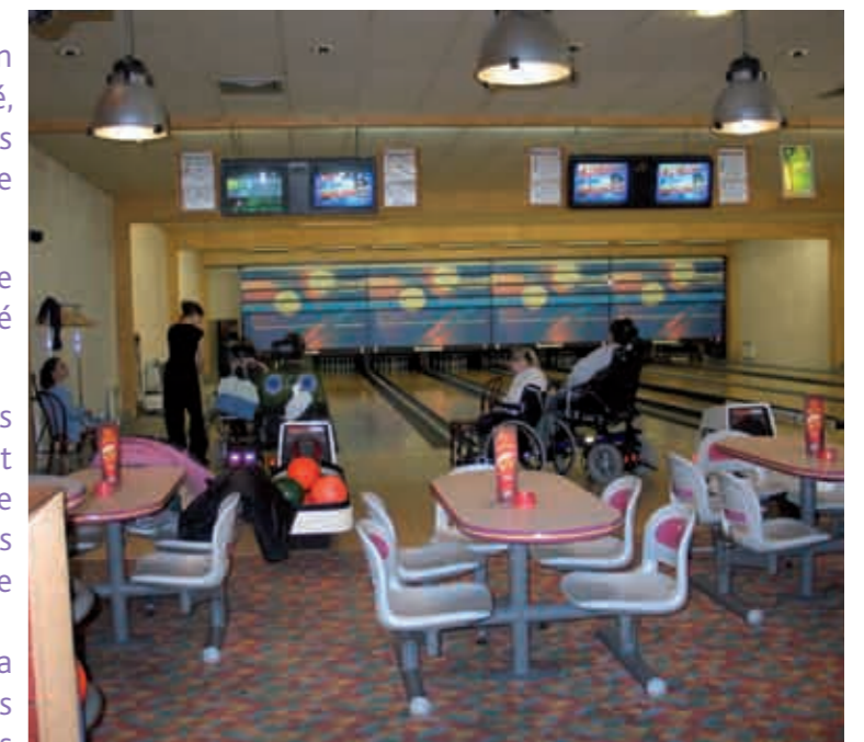
La base de loisirs de Caniel propose, au coeur de la vallée de la Durent, un site remarquable pour les loisirs. Une promenade autour du lac mais aussi un bowling sont accessibles aux personnes en situation de handicap.

Il est conseillé de se mettre en rapport avec la Direction Départementale de la Jeunesse et des Sports pour tout ce qui touche aux installations sportives. Sont concernés : piscines, plages, équipements balnéaires, salles de sport et tout site d'activités de loisirs sportifs.