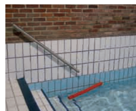
Main-courante d'accès au petit bassin avec nez de marches contrastés de la piscine de St Valery