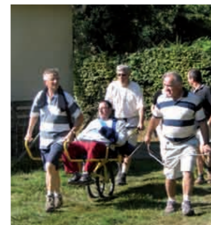
Groupe de randonneurs à pied et en joëlette