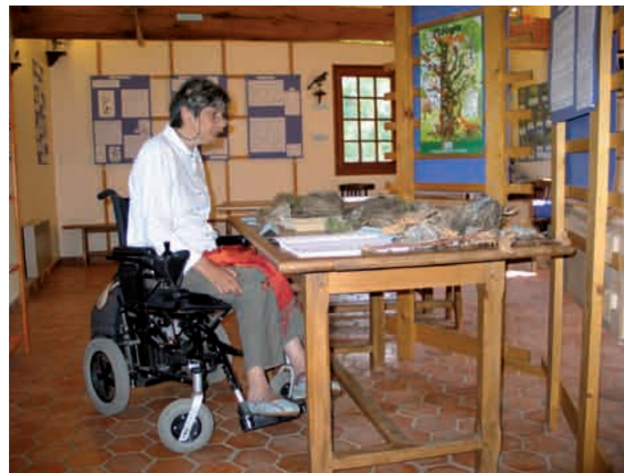
Salle d'exposition du jardin botanique du Mesnil Durdent

Eclairage sans reflet et éblouissement des œuvres et des circulations, signalisation des obstacles, guidage au sol, alarmes lumineuses, main courante et plans inclinés, prêts de fauteuils roulants mais aussi, systèmes d'aide à la visite (audio-guidage, système infrarouge ou HF, système d'écouteurs individuels) ou systèmes d'aide à l'audition (boucle magnétique, poignées télé magnétiques).