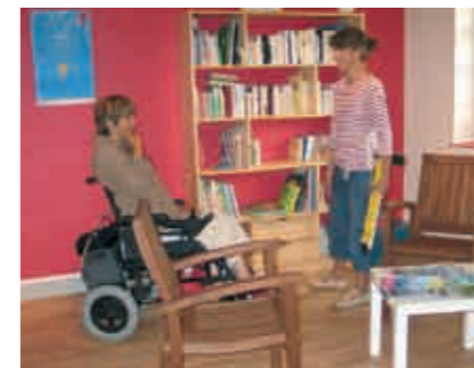
Bibliothèque accessible au Village de Vacances le Pré Marin à Sotteville sur Mer