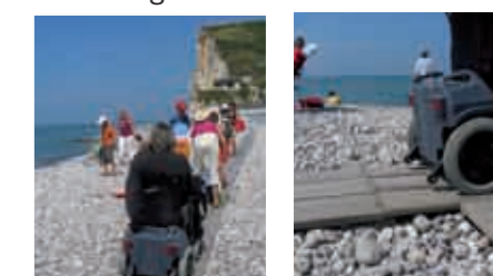
Cheminement (bien pensé mais trop étroit) sur les galets aux Petites Dalles. Il est utilisé par tous !