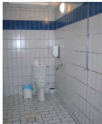
Pièce regroupant un WC adapté et une douche à la piscine de St Valery