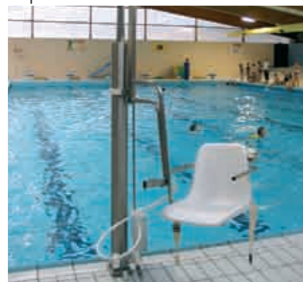
Siège de mise à l'eau dans le grand bassin de la piscine de Saint Valery en Caux