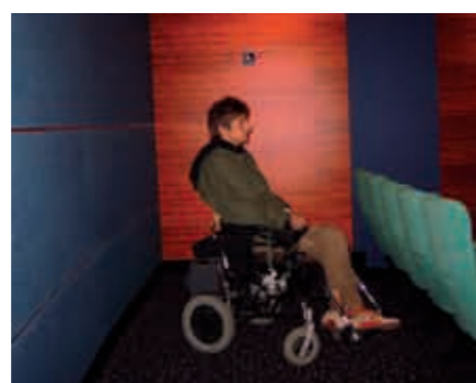
Cinéma du Casino de Saint Valery en Caux avec ses espaces adaptés au fond de la salle ou devant l'écran.