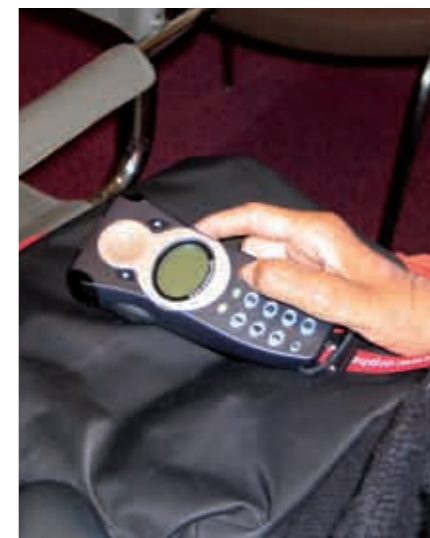
Audio-guide qui permet de visiter (en 3 langues) le Musée Municipal des Ivoires et l'église Saint Pierre d'Yvetot (deux sites accessibles avec accompagnement pour les personnes en fauteuil)