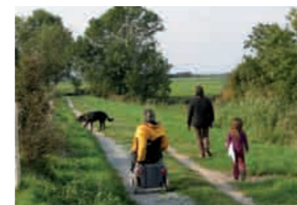
Randonnée sur le parcours de découverte autour de la ZNIEFF entre Paluel et Veulettes sur Mer