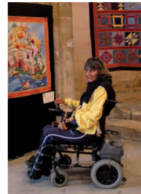
Le Festival du Lin dans la Vallée du Dun a sensibilisé les communes pour réaliser un plan incliné dans les églises et favoriser l'accès aux expositions.