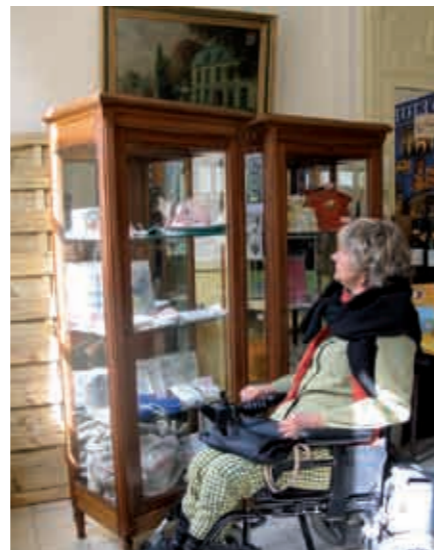
Boutique de l'Office de tourisme et du Musée Municipal des Ivoires d'Yvetot : circulation aisée entre les vitrines, objets à hauteur des yeux, ...