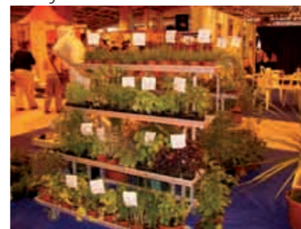
Présentation du muséum d'Histoire Naturelle de plantes médicinales et aromatiques au salon du handicap «Autonomic». Information visuelle, tactile, olfactive.