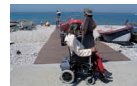
Descente en bois aménagée pour le bateau des secours à Yport qui, positionné sur le côté, permettrait d'accéder à la plage.